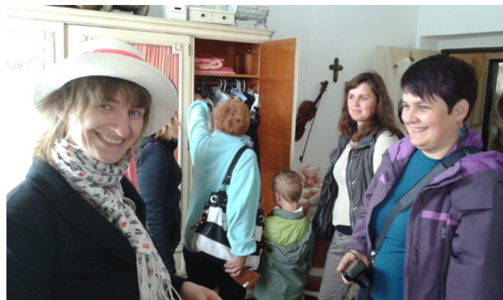
Okresní organizace ČSSD, Rychnovsko, 23. 5. 2015