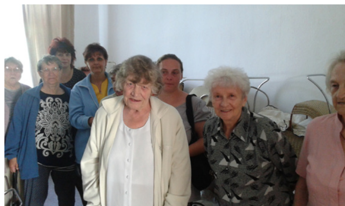
Domov důchodců, Borohrádek, 26. 6. 2015