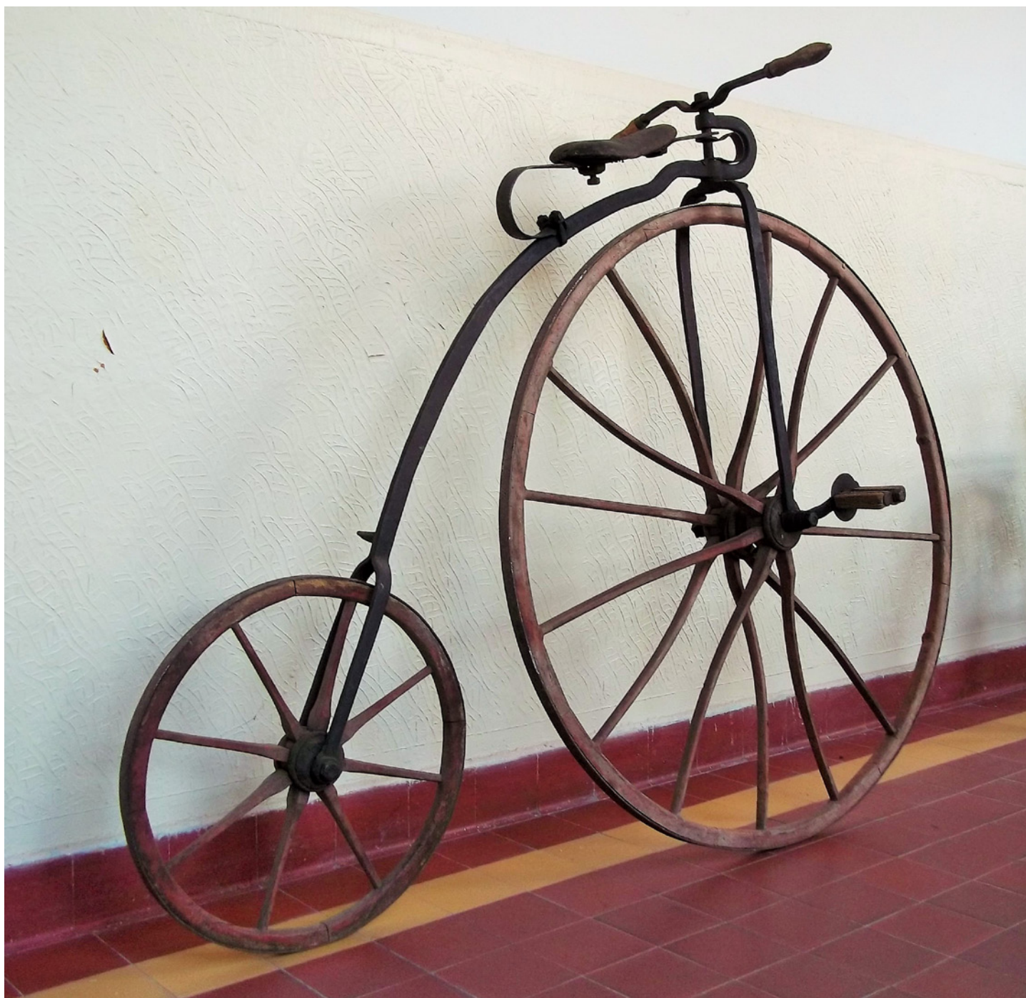
Lingerovo dřevěné vysoké kolo. MGOH v Rychnově nad Kěžnou.