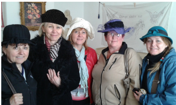
Návštěva zástupců partnerského města Čierny Balog, Slovensko, 28. 5. 2015