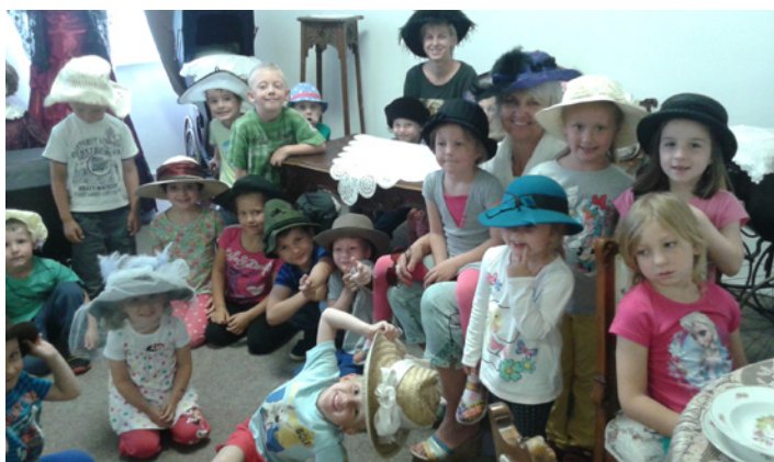
Děti z Mateřské školky Město, Týniště nad Orlicí, 9. 6. 2015