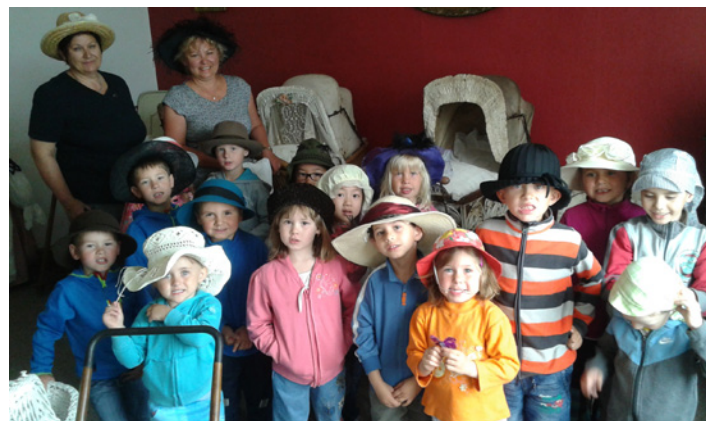
Děti z Mateřské školky Město, Týniště nad Orlicí, 9. 6. 2015