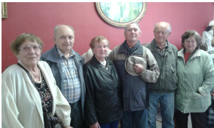
Klub důchodců, Týniště nad Orlicí, 19. 5. 2015

provozuje Podnikatelský klub Orlicko a Podorlicko, o.s. Provoz je financován z rozpočtu Města Týniště nad Orlicí a Královéhradeckého kraje.