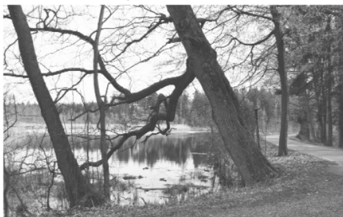
Lesní rybník Velká Houkvice

Použitá literatura: Plán péče o přírodní rezervaci U Houkvice na období 2006-2015, Ing. Miroslav Mikeska a kol.