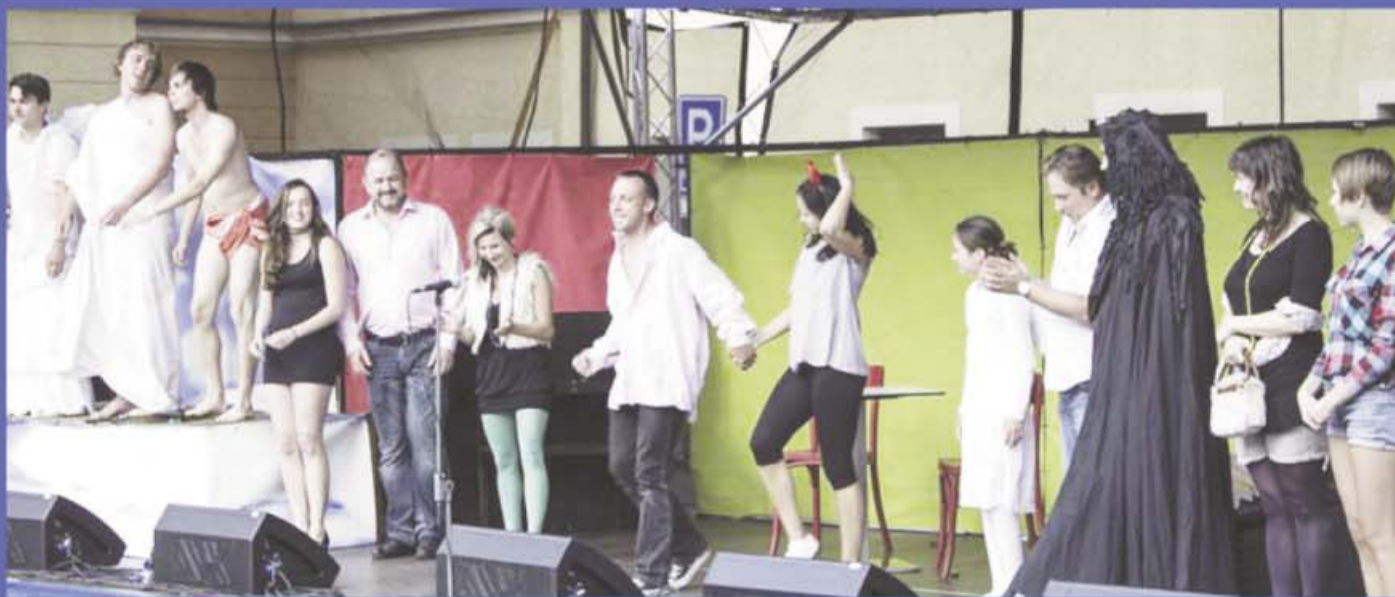
Den bíbec - děkovačka