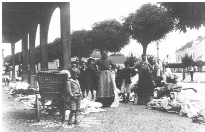
Trh u Brandejsů