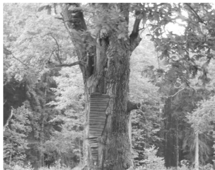
Dub u Houkvice - obvod 9m, výška 35m, věk přes 500 let

Houkvické rybníčky daly jméno celé přírodní rezervaci, již jsou součástí. Toto klidné zákoutí je chráněno zákonem od roku 1954 a právě v těchto dnech slaví své šedesátileté výročí. V přírodní rezervaci U Houkvice jsou důvodem ochrany napřík-