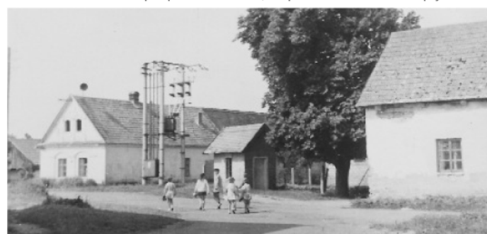
naposledy cestou z národní školy rok 1967- 1968