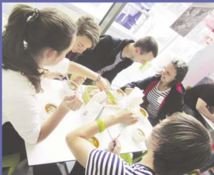
Bistro u dvou přátel