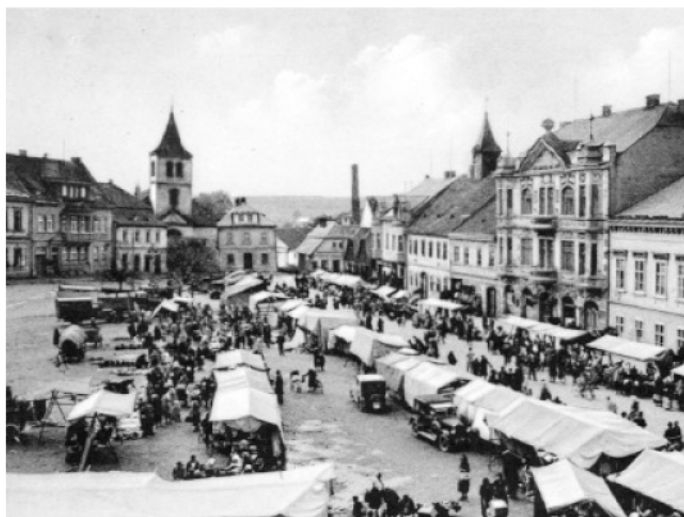
Výroční trh na náměstí 1934

šidlenky, babky, ovesnice, václavky, medovky, muškatelky, vladyky, harmoniky, komínky, kožlatky, holanice, cvergle, fajfky, hraběnky, kamenice, červinky, dubobky, plaňky, císařky, žitňačky, žlutky, máslovky, hrachůvky, koporečky.