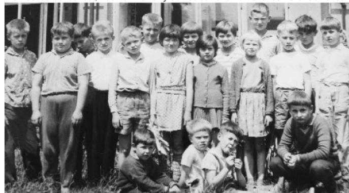
Školní rok 1964 - 1965