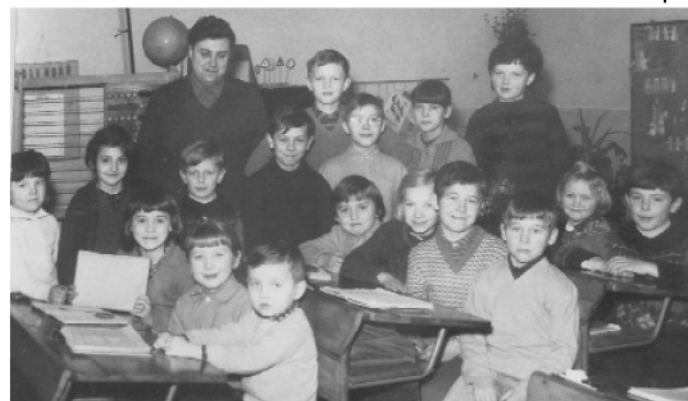
Školní rok 1967-1968