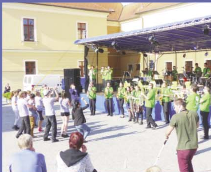
Mtb a podřekování od Ufonů