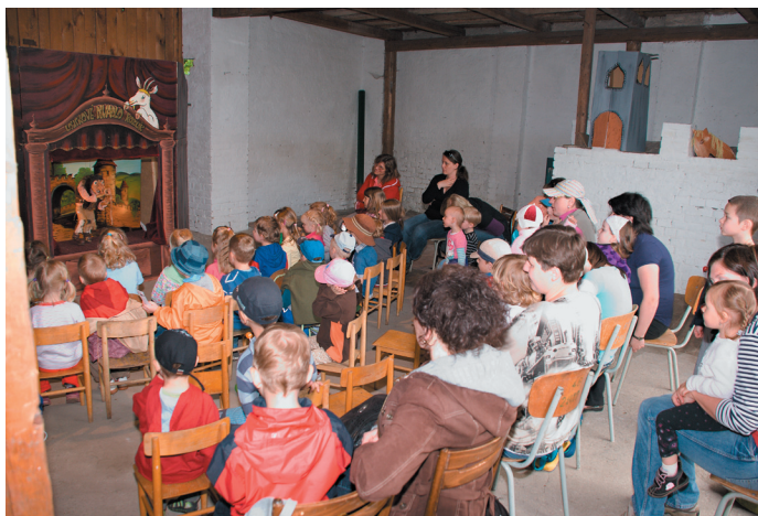
Loutkové divadlo Kozlík