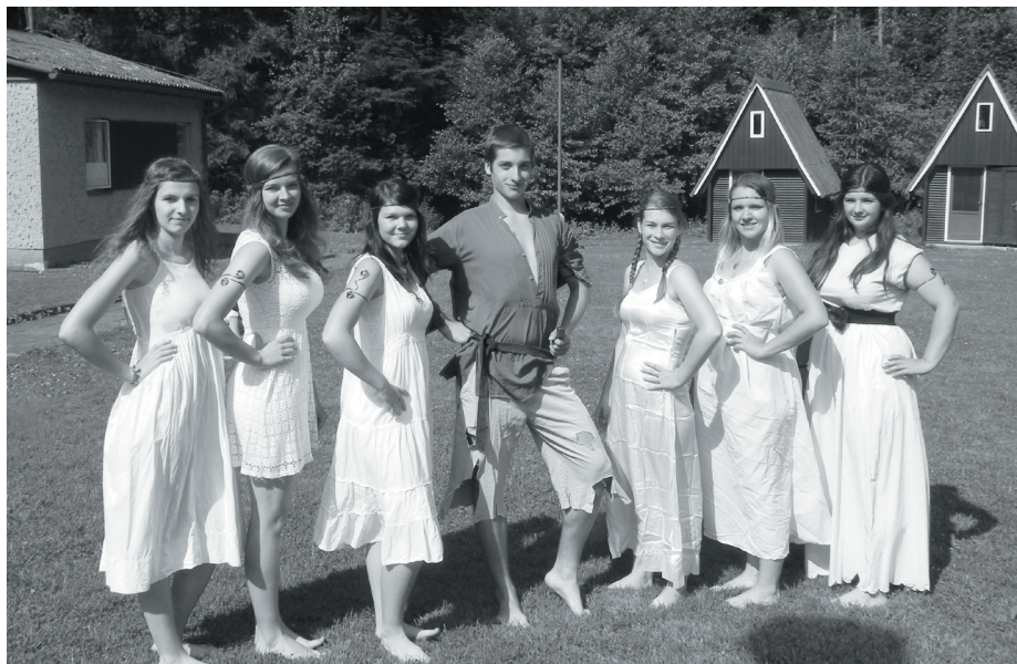
Pavlatovka - dívčí válka

O víkendu 29. - 30. 6. se v Brně konalo celostátní finále Minivolejbalu v barvách. V každé ze 6 kategorií se sjela družstva z celé republiky, která si vybojovala po-