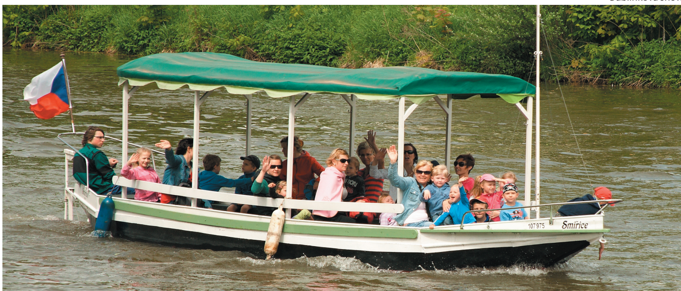
Plavba po Labi