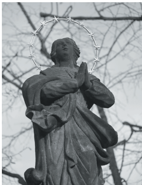
Sloup se sochou Panny Marie Immaculata