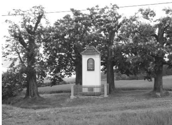
Martincův obrázek u Vrbice