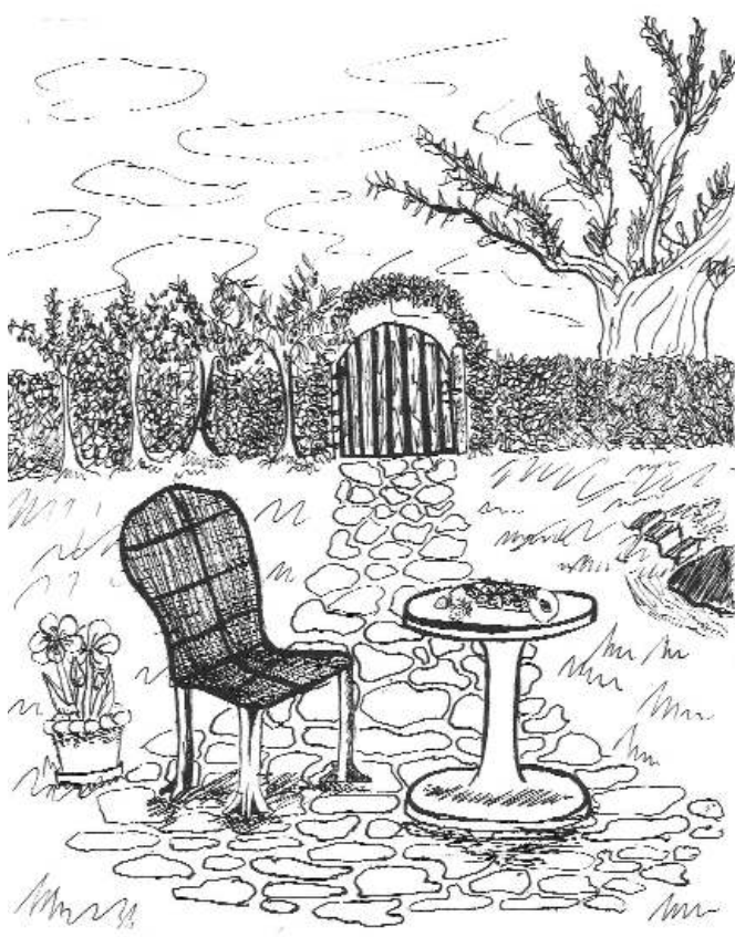
Ilustrace -Michaela Voborníková

divokými psi utíká provlasá dívka s dítětem v náručí. Pak najednou se obraz ztratil v černých hlubinách lesa a vzduchem prolétl zoufalý výkřik lidské bolesti... Byl to prý duch milenky hraběte, krásné Italky, která velice toužila vrátit se do slunné Itálie i přes to, že měla dítě. Hrabě ji nechal hlídat hajným, aby mu milenka neutekla. Jednou, to zrovna hajný vyháněl z lesa děvčata, co v lese sbírala svatojánské kvítí, podařilo se krásné Italce i s dítětem prchnout. Když hajný zjistil, že mu milenka hraběte utekla,