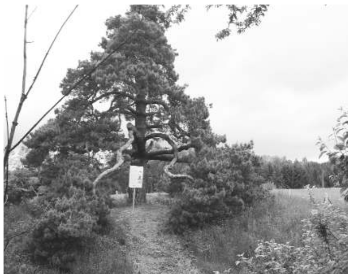
Svídnická borovice, stáří asi 270 let

nimi ale určitě vynikají čtyři 120leté jírovce maďaly, které spolu s kapličkou zvanou Martincův obrázek, vytvářejí takřka idylické místo na východním okraji turisticky vyhledávané vsi. Jírovce se do celé Evropy rozšířily ze své původní domoviny na Balkáně, z horských oblastí Řecka, Albánie a Bulharska. Pro svůj krásný vzhled si je lidé brzy oblíbili a i u nás zdomácněly. Netřeba dlouze popisovat jejich estetické využití v parcích a stromořadích a jaké povyražení nám na podzim způsobuje sběr lesklých plodů. Jírovec přináší člověku užitek také v lékařství. Obsahuje důležité látky, které působí protizánětlivě, urychlují vstřebávání otoků a zvyšují odolnost žil. Ve zvláštním pojmenování stromu, nazývaného běžně kaštan, ukryli první čeští přírodovědci stručný popis a